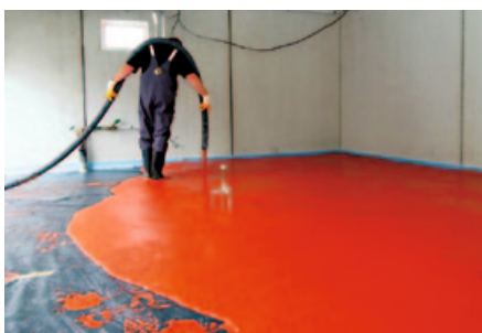
Gießen des Estrichs

Der Einbau des farbigen Estrichs muss so in den Bauablauf eingebunden sein, dass Beeinträchtigungen der Oberfläche vermieden werden. Jegliches Betreten nach der Verlegung und die Nutzung zur Lagerung von Baumaterialien o. Ä. während der Trocknungsphase sind zu vermeiden. Unterschiedliche Trocknungsbedingungen können aufgrund unterschiedlicher Gefügeentwicklung der Bindemittelmatrix zu bleibenden Farbunterschieden führen. Die vollständige Abdeckung der Fläche mit Rohfilzplatte ist empfehlenswert. Dadurch verlängerte Trocknungszeiten sind zu berücksichtigen und ggf. durch den Einsatz von Trocknungsgeräten gegen Ende des Trocknungsvorgangs zu kompensieren. Da eine weitere Verwendung von Restmengen farbigen Estrichmörtels auf anderen Baustellen nicht ohne weiteres möglich ist, ist die Rückvergütung in der Regel nicht möglich. Klare Vereinbarungen im Vorfeld zwischen Mörtelhersteller und Bauleitung/ Bauherr werden empfohlen.